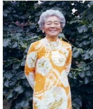
Hawayo Takata (1.900-1.980)