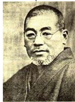
Mikao Usui (1.865-1.926)